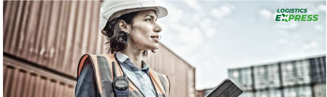
Versión color fondo fotográfico color claro

Se deben evitar fondos que no permitan la correcta visualización del logotipo, en su versión color o monocromática.