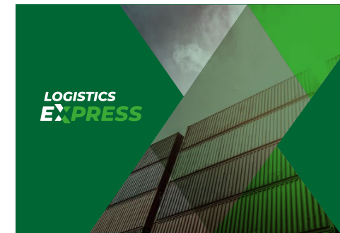
Símbolo contenedor de imágenes sobre fondo verde