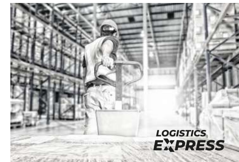
Versión monocromática fondo fotográfico BN claro