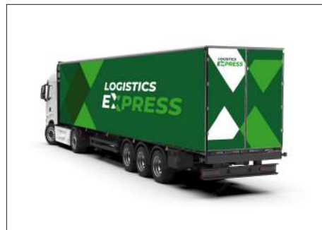
EJEMPLO APLICACIÓN VEHÍCULOS