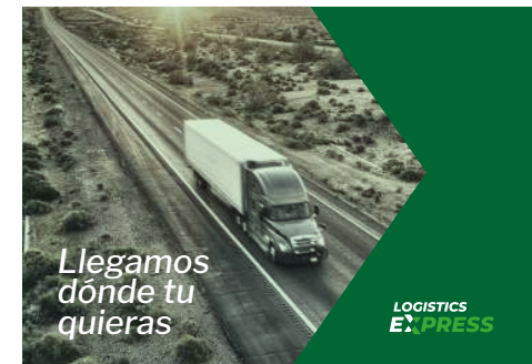
EJEMPLO APLICACIÓN GRÁFICA