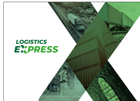
Símbolo contenedor de imágenes sobre fondo blanco