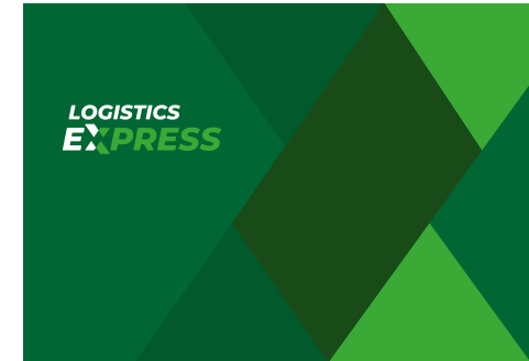
Símbolo sobre fondo verde