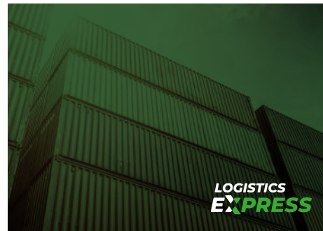
Versión color fondo fotográfico verde