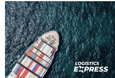
Versión monocromática fondo fotográfico color oscuro