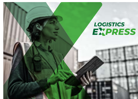
Símbolo sobre fondo fotográfico